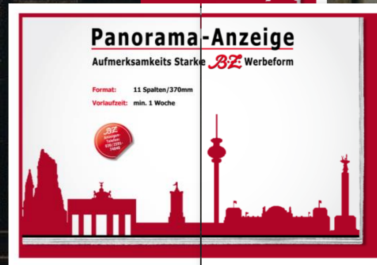
Mantel-Innenseiten-Panorama, Tabloid: (532 mm breit, 369 mm hoch)

Format: 11 Spalten/370mm Vorlaufzeit: min. 1 Woche