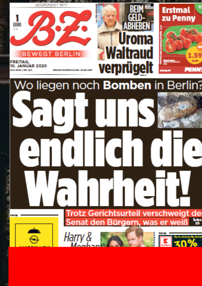
Mantel-Titelseite: Streifen 5-spaltig/ 40 mm hoch