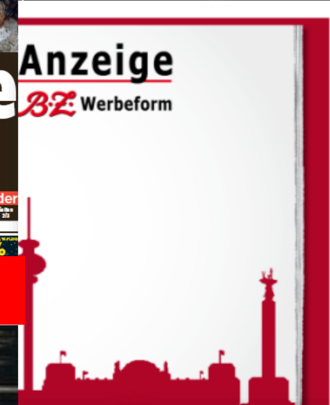
Anzeige B.Z. Werbeform