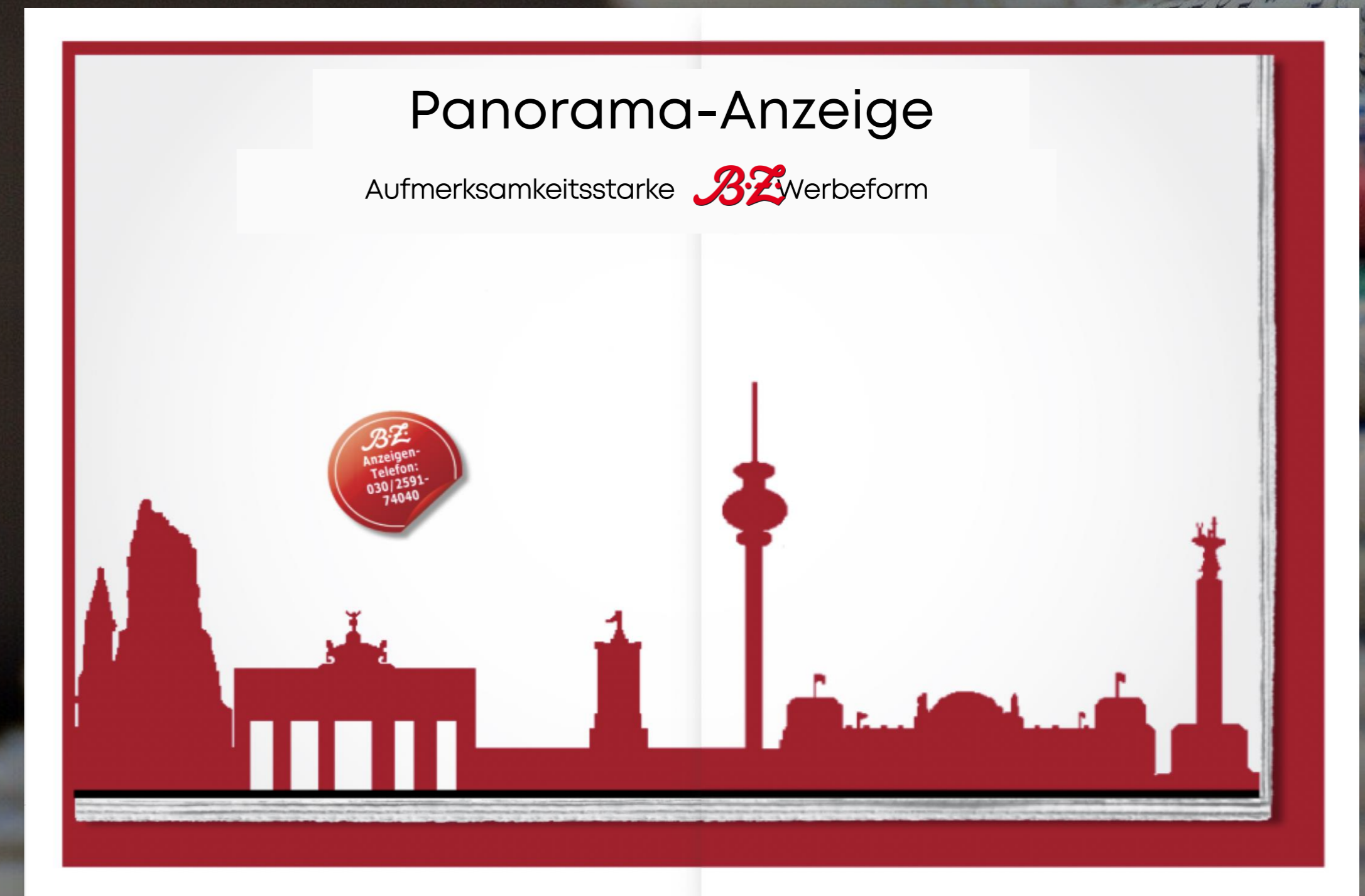
2/1 Panoramaseite über Bund, Heftmitte. Auf Anfrage möglich.