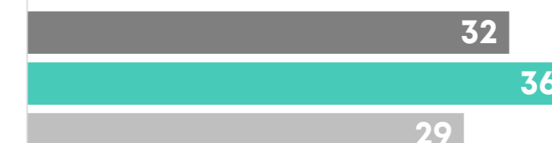
■ Bevölkerung ■ BILD ■ regionale Abo-Zeitungen

planen und buchen ihren Urlaub 2-3 Monate im Voraus