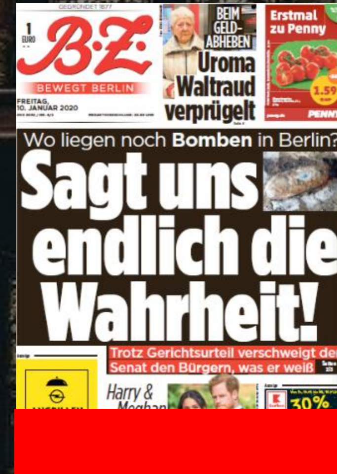
Mantel-Titelseite: Streifen 5-spaltig/ 40 mm hoch