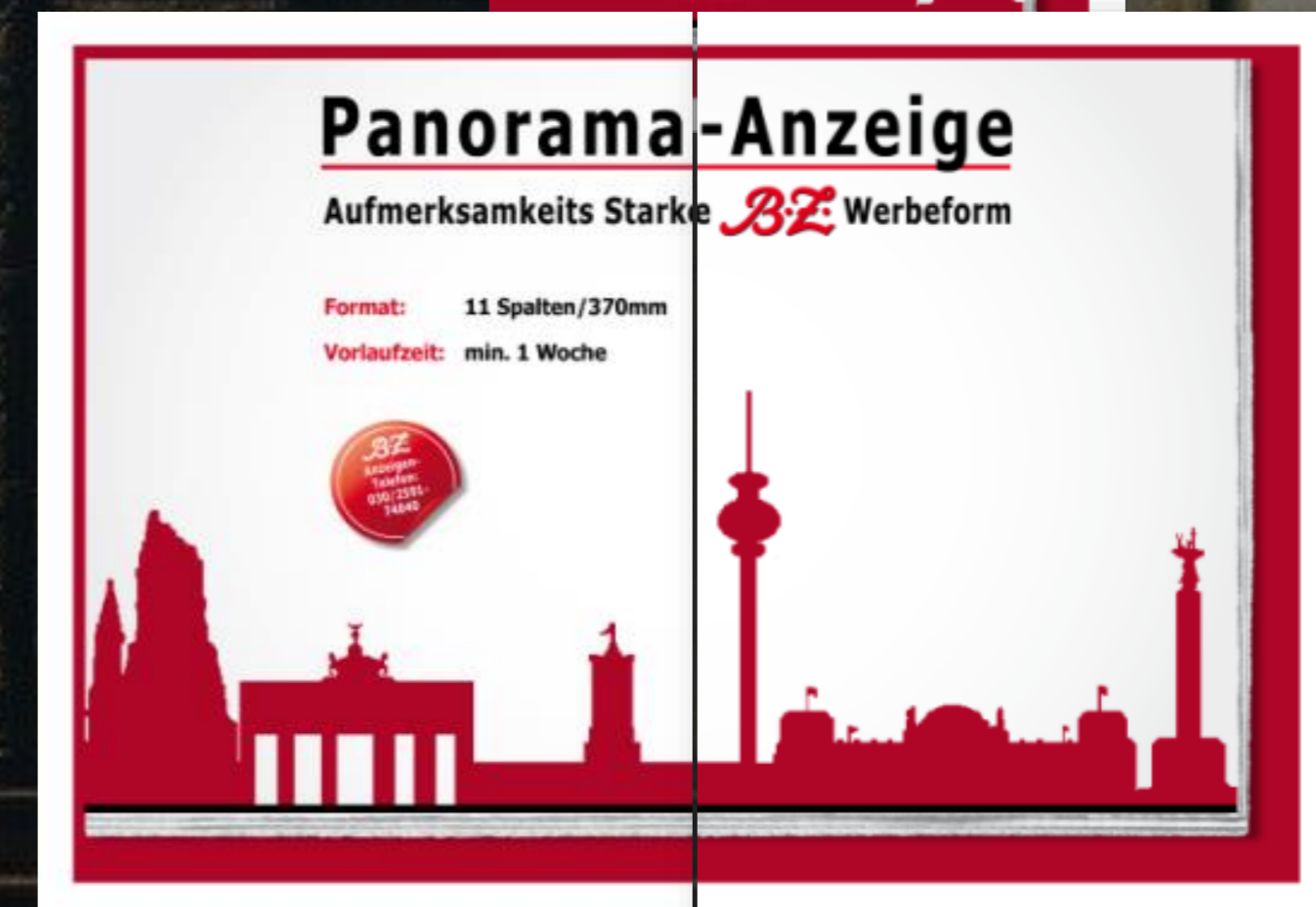
Mantel-Innenseiten-Panorama, Tabloid: (532 mm breit, 369 mm hoch)