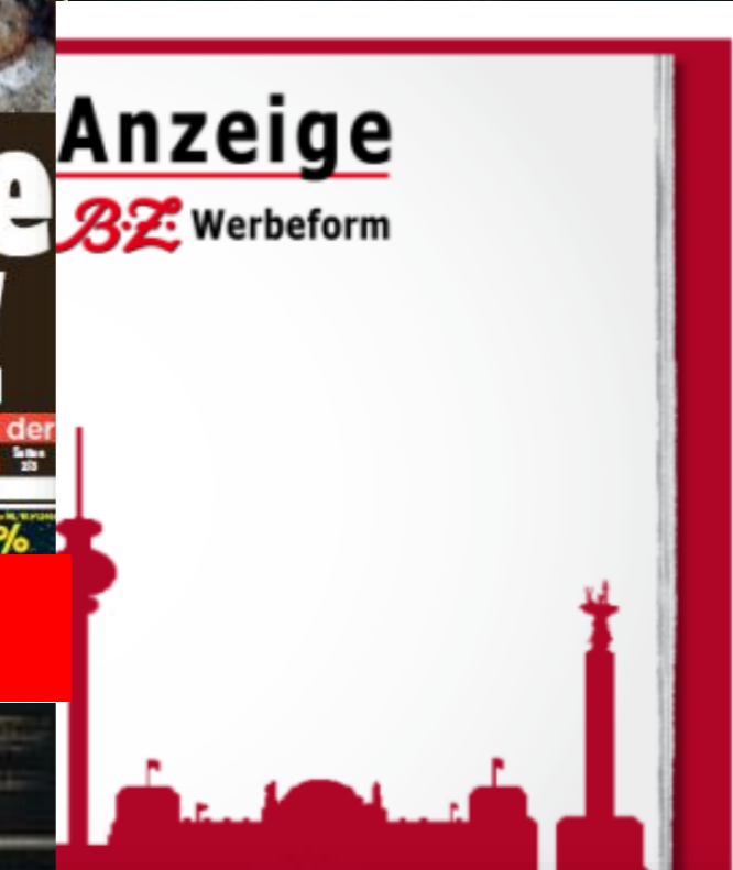
Mantel-Rückseite: 1/1 Seite Tabloid (257 mm breit, 369 mm hoch)