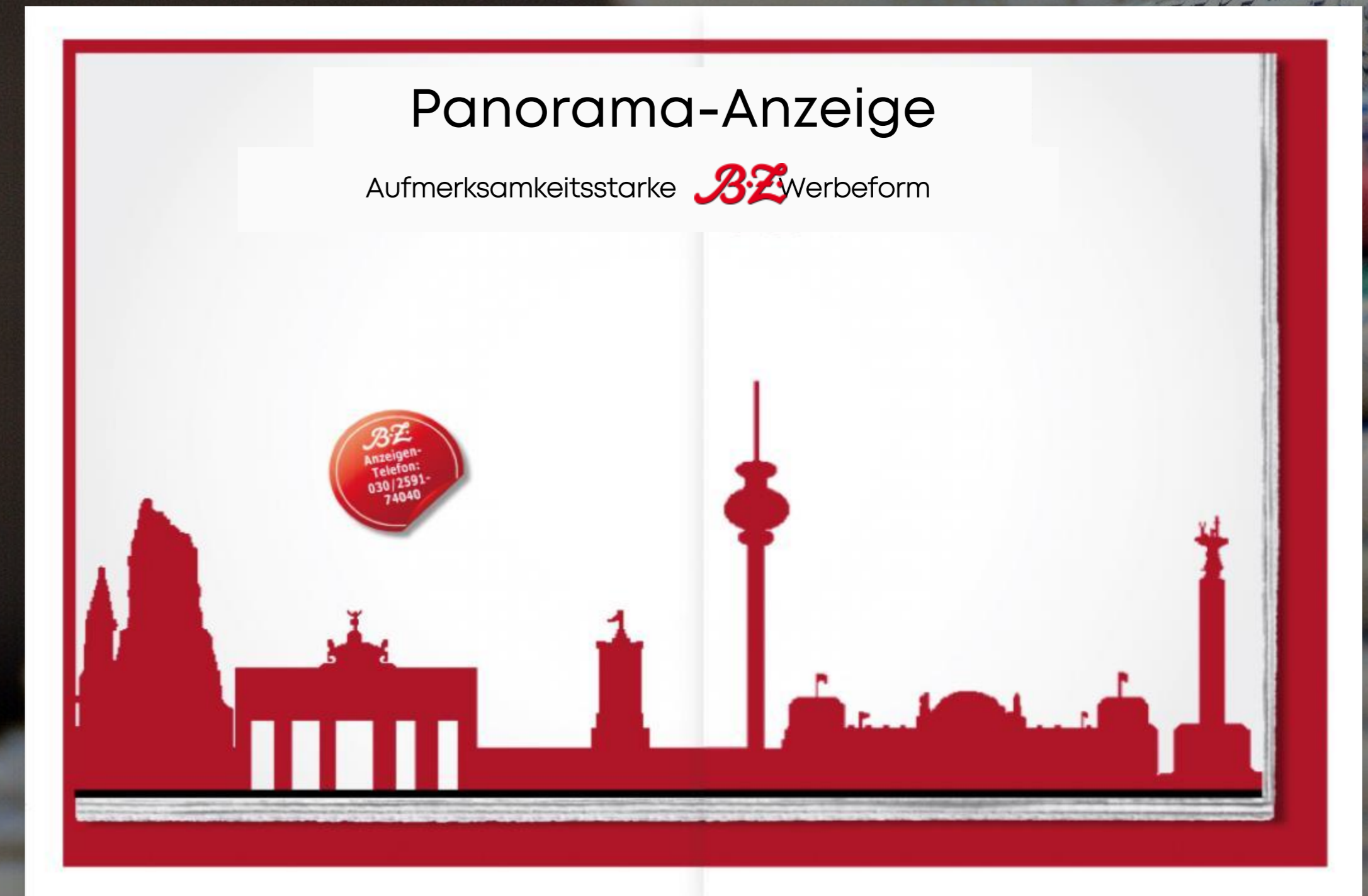
2/1 Panoramaseite über Bund, Heftmitte. Auf Anfrage möglich.